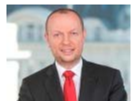
Univ.-Prof. DDr. Thomas Dangl

Der Spängler IQAM Sentiment Index Europe ist mit 0,33 (Ende September) im Vergleich zum Vormonat mit 0,66 (Ende August) abgefallen. Die Hauptursache ist ein deutlicher Abfall der Marktstimmung. Die ökonomischen Indikatoren blieben beinahe unverändert. Der Spängler IQAM Sentiment Index Europe liegt im neutralen Bereich.