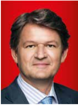
Dr. Helmut Brandstätter

ist KURIER-Herausgeber. Nach dem Jus-Studium an der Universität Wien, wo er auch Vorsitzender der Hochschülerschaft war und zum Dr. jur. promovierte, startete er seine Karriere 1982 in der ORF-Auslandsredaktion, danach war er ORF-Korrespondent in Bonn. Ab 1986 war er für den Aufbau des ORF-Studios in Brüssel verantwortlich. In den Jahren 1987 bis 1991 war er ORF-Studioleiter Bonn mit Zuständigkeit für BRD, DDR und EU, ab 1991 übernahm er die ORF-Hauptabteilungsleitung „Politik und Zeitgeschehen“. 1995 gründete und moderierte er die ORF-Sendung „Report“. 1997 bis 2003 war Dr. Helmut Brandstätter Geschäftsführer des Nachrichtensenders n-tv in Berlin. 2003 kehrte er als Geschäftsführer des neu gegründeten Regionalsenders „PULS TV“ nach Österreich zurück. In dieser Zeit fungierte er auch als Moderator der Nachrichtensendung Top News beim Sender „Pro7 Austria“. 2005 schied er aus und gründete die „Brandstätter Consulting GmbH für Kommunikation- und Medienberatung“. Seit August 2013 ist Dr. Brandstätter KURIER-Herausgeber. Dr. Helmut Brandstätter hat mehrere Publikationen veröffentlicht, wie zum Beispiel: „Fernsehen mit Kindern“, „Politik am Gängelband der Medien“ und „Hör. Mir. Zu. Drei Schritte ins Jahrtausend der Kommunikation“.