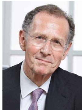
Prof. Dr. Dr.h.c. Bert Rürup